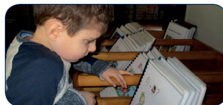
Pictoleesboek 'Waar is Suske?' in de schoolbibliotheek van BSBO Wilgenduin in Kalmthout.

REACTIES? MAIL VIA CONTACT@PICTOSCHRIJVER.NL OF TRIJNTJE@LEZENMOETJEDOEN.NL