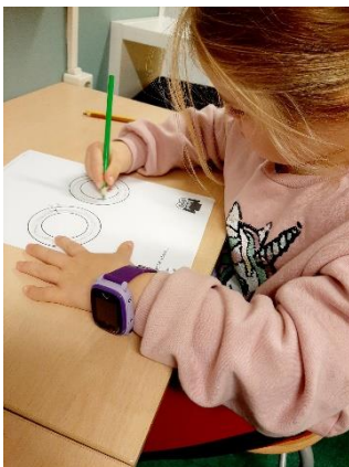
De oo schrijven, A4 formaat

Elk hoofdstuk van de map 'Lezen wat je kunt' bevat op de laatste pagina grote en kleine railsletters om het schrijven te oefenen. Alle letters van haar naam heb ik gekopieerd en naast elkaar geplakt. Daarna de naam verkleind. Het was een hele klus maar zo leuk voor haar om zo haar eigen naam te leren schrijven!