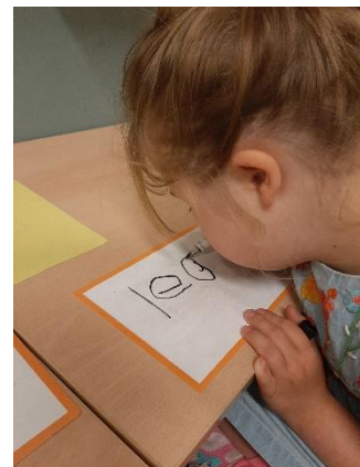
Schrijven op een wisbordje